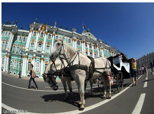
San Pietroburgo: l'Ermitage