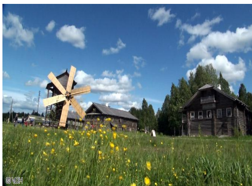
Mandroga: costruzioni in legno